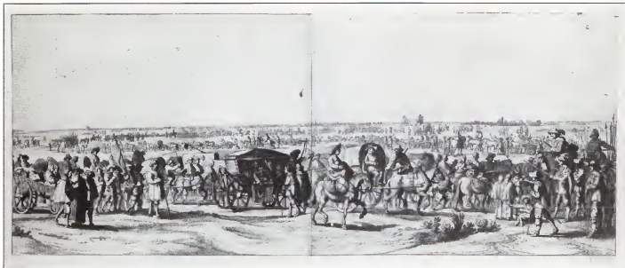
Lijftogt van het garnizoen uit Breda, gravure, 1637